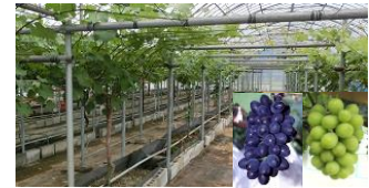
東京型ブドウ環境制御栽培システム