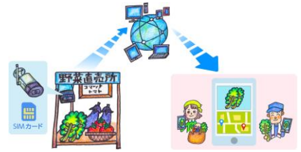
庭先直売所支援システム

先進技術導入に対する都内生産者のニーズ調査や先進技術活用事例調査に基づき、庭先直売所支援システムや東京型ブドウ環境制御栽培システム、軽量フレキシブル太陽電池利用システムなど、新たな農業システムの実証実験を行います。