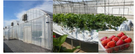
東京フューチャーアグリシステム

「東京フューチャーアグリシステム」は、(公財)東京都農林水産振興財団の登録商標(登録番号第6196995号)。