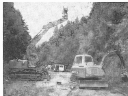
図3 スイングヤーダ(左)とプロセッサ(右)