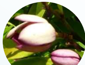
カラタネオガタマの花

緑化森林科では引き続き、街路の現地調査と圃場試験により、光が十分には届きにくい環境に耐える中木を調査していきます。（緑化森林科）