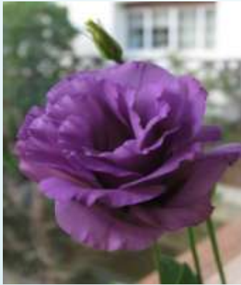
プラティニブルー

青色系トルコギキョウ「プラティニブルー」は、当センター育成のトルコギキョウ「東京E1号」を片親として、東京都種苗会育成の優良トルコギキョウ系統との交配から生まれました。花色は清涼感をもつ青紫色で、花卉の巻きはよく、花型も乱れず安定するなどの特徴があります。