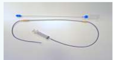
子宮頸管カテーテル（上）と子宮角深部注入カテーテル（下）

今年度凍結精液による人工授精の結果は、下の表に示したように通常の授精法ではやや低い成績となりましたが、特殊なカテーテル（右写真）を用いた深部注入法で授精することで、自然交配と変わらない産子数を得ることができました。