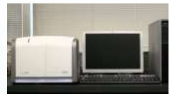
次世代DNAシーケンサー

DNAは、ほとんどの生物の細胞に含まれており、リン酸・糖・4種類の塩基(A:アデニン, G:グアニン, C:シトシン, T:チミン)から構成される単位が長く連なっています。塩基の並び方(塩基配列)は、生物の種類や個体により特徴があります。その塩基配列を読み取る機械がDNAシーケンサーです。