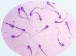
トウキョウXの精子（凍結精液）

青梅庁舎は、おいしい豚肉「TOKYOX」の種豚供給基地です。しかし、海外から口蹄疫などの伝染病が侵入し、病気にかかった場合には、飼っているすべてのトウキョウX豚を処分しなければならず、皆様に親しまれてきた豚肉「TOKYOX」は消え去ってしまいます。畜産技術科では、このような事態に備え、都民の皆様に東京特産物としておいしい豚肉を継続して供給できるように、トウキョウX豚の精液を凍結処理し、遺伝資源として保存する試験を行っています。