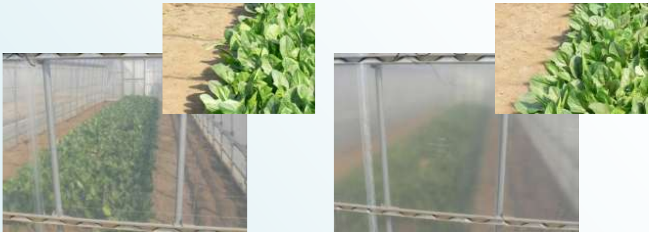
透明フィルム（左）と散光性（散乱光性）フィルム（右） ※影の違いを見てください。

一方散光性（散乱光性）フィルムは、害虫防除機能はないものの、光を拡散させハウス内全体に光を行き渡らす機能を持つ資材です。ハウスの骨材や葉による影が少なくなるため、植物体や群落全体の光合成が高まると考えられ、温室メロンの栽培などで利用されています。