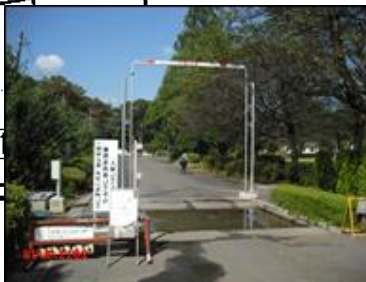
(東門) 消毒薬噴霧装置