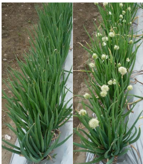
「東京小町」(左)は在来系統(右)にくらべ、抽だいが少ない。