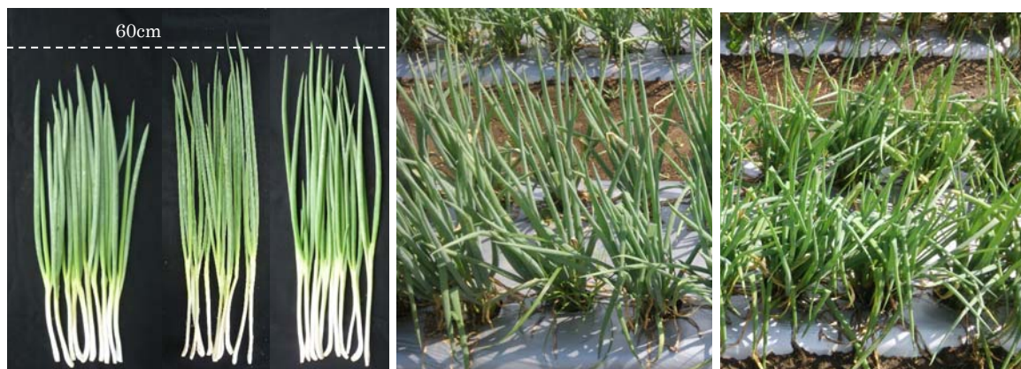
左「東京小町」、中「在来系統」、 右「夏用系統」 (平成25年9月11日撮影)