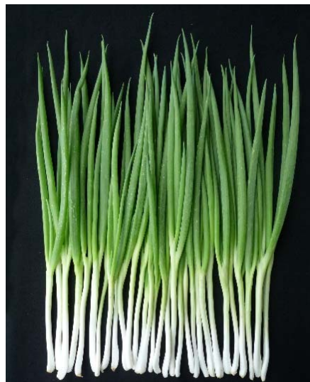
「東京小町」は、緑と白のバランスが美しく、畑でのシャキッとした立ち姿から命名しました。